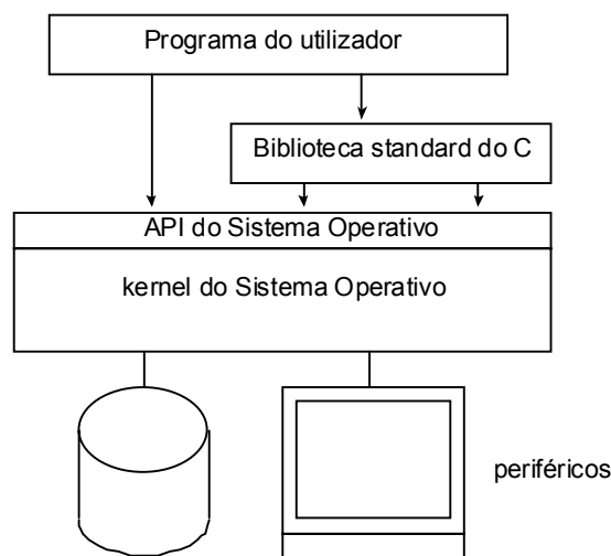
A posição da biblioteca standard do C

A biblioteca standard da linguagem C ( ANSI C library ) contém um conjunto rico de funções de acesso, criação, manipulação, leitura e escrita de ficheiros em disco e dos 3 componentes da consola. A utilização dessas funções torna os programas independentes do Sistema Operativo, uma vez que a biblioteca standard é a mesma para todos os S.O.'s. No entanto introduz uma camada extra entre o programa e o acesso aos objectos do S.O. (ficheiros, consola, etc) como se ilustra na figura seguinte.